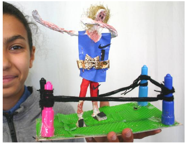
...een wedstrijd in de ring...