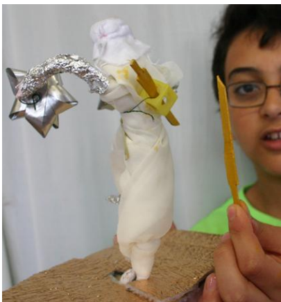
...een ninja met handgesneden zwaarden...

Het is een bonte verzameling geworden met types van allerlei pluimage.